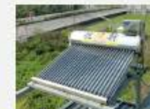
南投傑生環保賴董公館