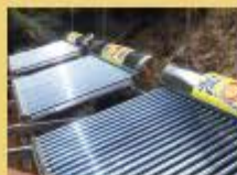
玉山排雲山莊(串聯)