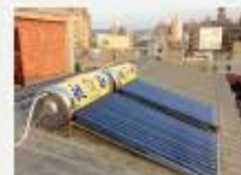
新竹徐老闆出租套房(串聯)