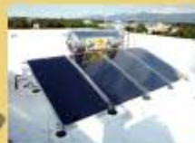
彰化縣陳議員公館