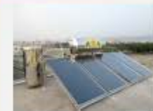
桃園電子公司陳總公館